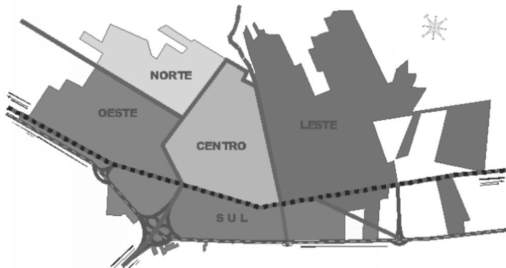
Figura 1. Mapa da área urbana do município de Tupã-SP e localização das respectivas zonas.

De acordo com IBGE (2007), o município Tupã possui 62.256 habitantes. Na Tabela 1 são apresentados os dados da distribuição da população urbana